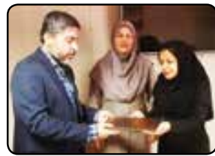
طی حکمی از سوی مدیریت باشگاه ستارگان احمدی