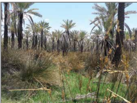
نخلستان‌ها به مکانی برای زندگی گرازهای وحشی تبدیل شده‌است

این سیل به گفته‌ی مسئولان، حداقل ۹ هزار میلیارد ریال به زیرساخت‌های استان هرمزگان در دو شهرستان جاسک و بشاگرد خسارت وارد کرد. سد «گابریک» در شهرستان جاسک، درحال حاضر با مخزن ۲۷۰ میلیون مترمکعب، یکی از طرح‌های بزرگ برای تامین آب در این منطقه است.