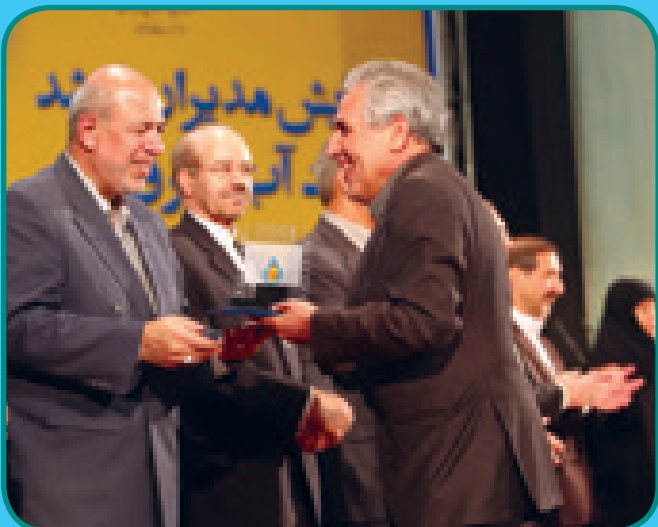
کسب رتبه برتر در همایش مدیران ارشد وزارت نیرو ۹۳