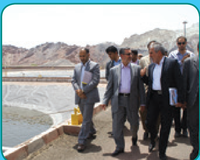
مراسم افتتاحیه تصفیه خانه فاضلاب جزیره هرمز