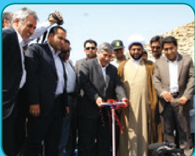
افتتاح مخزن آب بندرلنگه با حضور وزیر نیرو