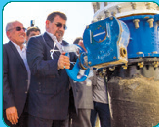
افتتاح مخزن ۲۰ هزار مکعبی بندرعباس با حضور استاندار هرمزگان