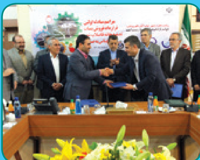
مراسم فروش اولین بساب تصفیه خانه فاضلاب بندرعباس به صنعت