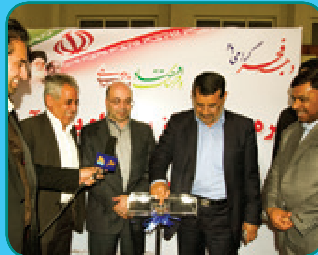
افتتاح ایستگاه پمپاژ آب داماهی با حضور استاندار و مدیر عامل آبفای کشور