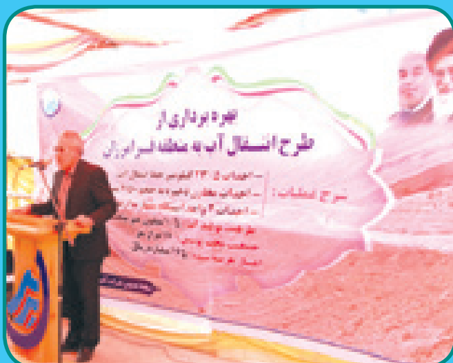
مراسم افتتاحیه طرح آبرسانی به منطقه فرامرزان