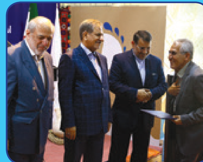
دریافت لوح تقدیر از دست معاون اول رئیس جمهور در افتتاح تصفیه خانه آب جاسک