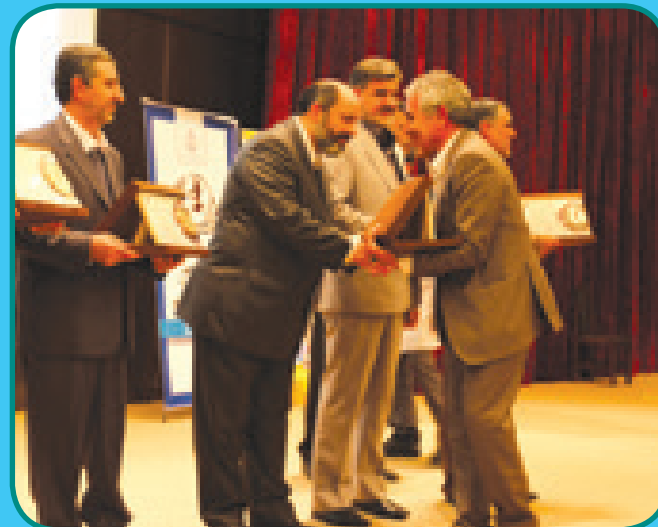
کسب نشان برتر جایزه ملی بقراط