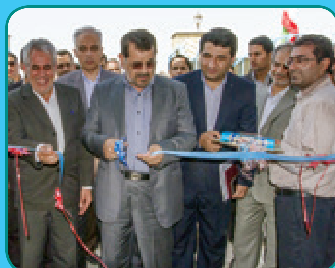
افتتاحیه آبشیرین‌کن لنگه با حضور استاندار هرمزگان