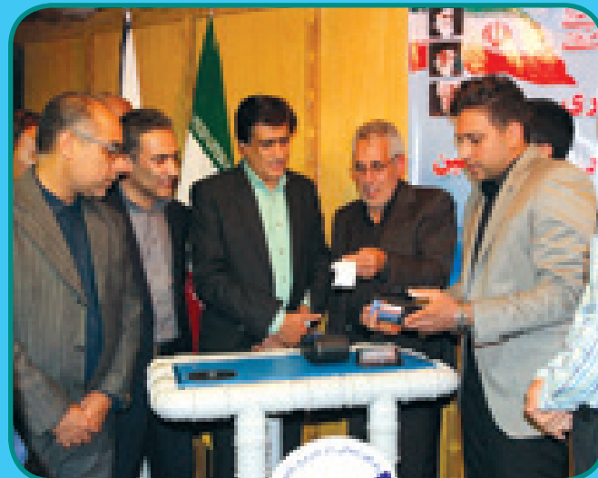
افتتاح طرح صدور و پرداخت آبی قبوض آب با حضور معاون سیاسی امنیتی استاندار