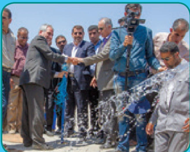
افتتاح مخزن فارغان با حضور استاندار هرمزگان