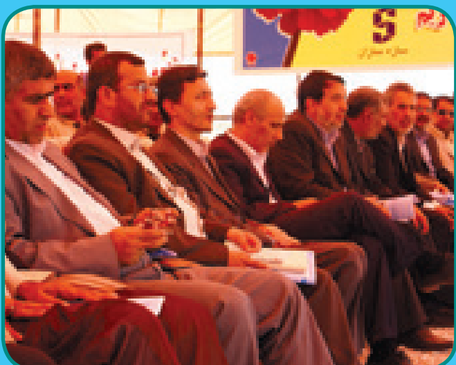
مراسم افتتاحیه آبشیرین‌کن بندرلنگه با حضور مهندس فتاح وزیر سابق نیرو