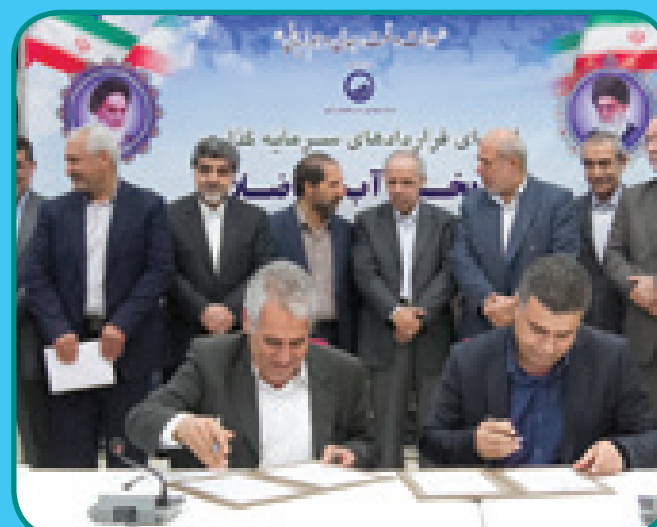
امضاء قرارداد واگذاری بساب به بخش خصوصی با حضور وزیر نیرو و استاندار هرمزگان