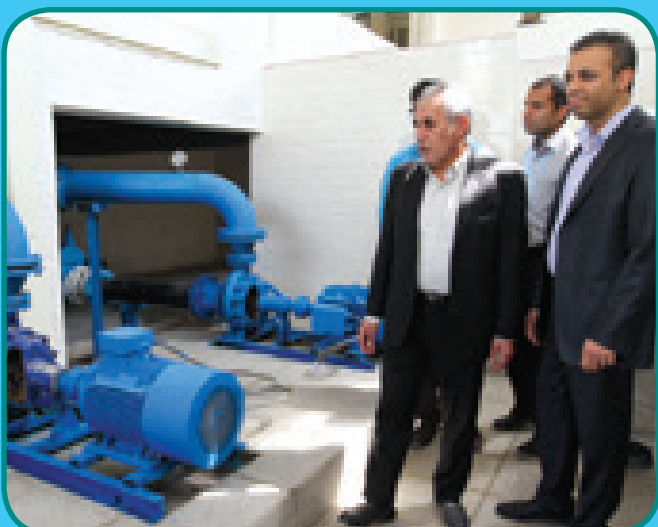
بازدید از تصفیه خانه آب جاسک