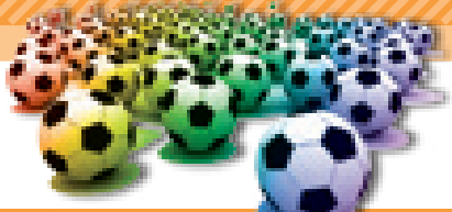
تیم فوتبال بندرعباسی در دیدار مقابل تیم فوتبال بندرلنگه