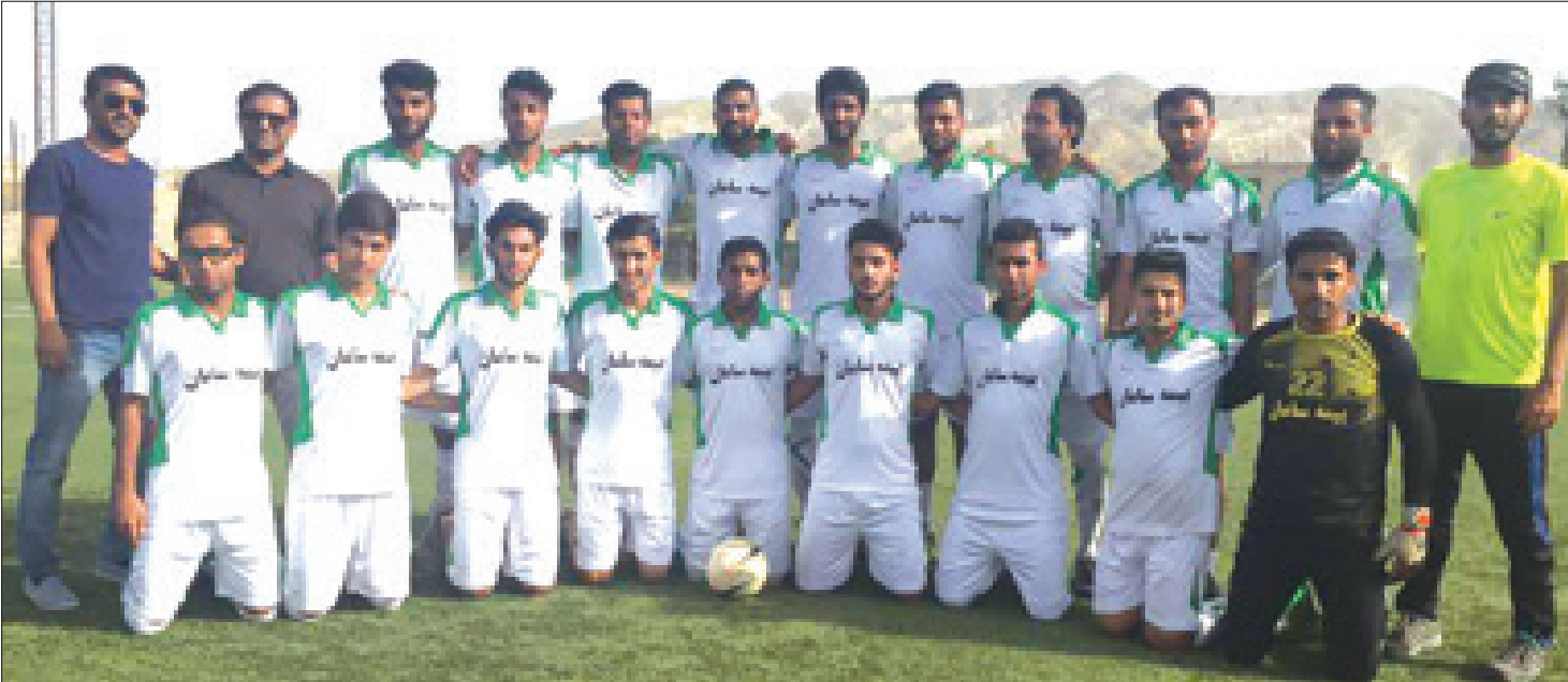
گروه ورزشی //