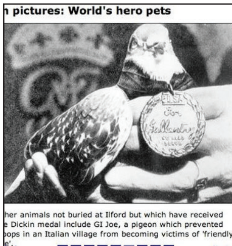
Other animals not buried at Iiford but which have received the Dickin medal include GI Joe, a pigeon which prevented plops in an Italian village from becoming victims of 'friendly fire'.