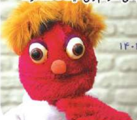
آقای اووو - تابستان ۱۴۰۲

هوا روز به روز گرم تر میشود . فصل خرما پزان است اما انگار ما نیز با آن میزیم . امروز باید درس هایم را مرور میکردم . مامان خیلی زیاد فشار میاورد باید در تابستان هم درس بخوانم ، اصلا حواسش نیست تابستان شده و من استراحت میکنم . ولی چه کنم مامان است دیگر . اتفاق عجیبی افتاده . قرار بود مسافرت برویم . اما حالا پول آن را مرغ و گوشت و خرید خانه انجام داده ایم . خیلی دوست دارم پدرمو مادرم را درک کنم ولی من مسافرت میخوام!!!!.... بیخشید ، من مسافرت میخوام اما نمی شود . دیروز سر کلاس چرتکه ، اصلا حواسم به عددهای توی جدول نبود و داشتم هزینه های خانه را چرتکه می انداختم ولی آخرش هم به مسافرت نرفته مان رسیدم . دوستم فارسی کلاس ششم را می خواند می گوید میخوام خیلی در درس های سال قوی بشوم . منم قوی هستم ولی تابستان است نباید درس بخوانیم که . همین افراد نگاه خانواده را به ما خراب می کنند . منم چند روزی است دیگر با او حرف نمیزنم تا بفهمد نباید در تابستان درس بخوانیم . تازه با یکی دیگر در کلاس اسکرچ دوست شده ام قرار است چند تا بازی ترسناک بسازیم . من که تابستان را خوب می گذرانم ولی حیف که مسافرت نمی رویم .