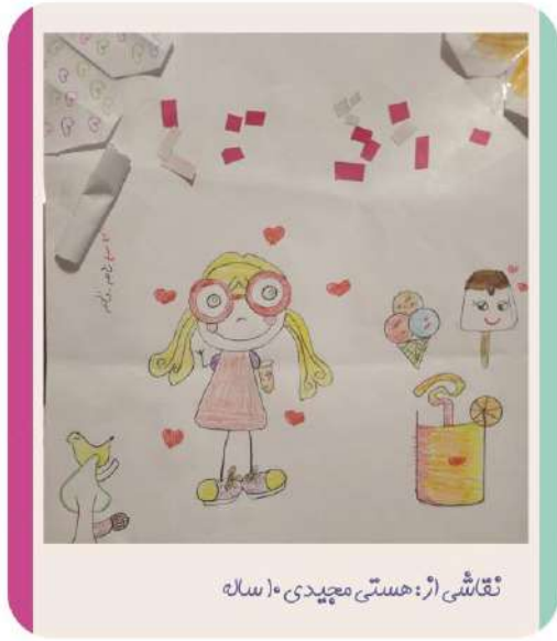
نقاشی از: هستی معینی ۵ ساله