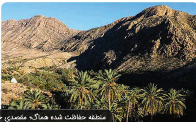
منطقه حفاظت شده هماگ؛ مقصدی خوش منظره در بخش جنوبی حاجی آباد

حاجی آباد شهرستانی است در شمال استان هرمزگان در جنوب ایران. این شهرستان با استان کرمان هم‌مرز است و آب و هوای خنک‌تری نسبت به سایر شهرهای استان هرمزگان دارد. نزدیکی این منطقه به کوهستان نیز باعث می‌شود این شهر نسبت به سایر شهرستان‌های هرمزگان آب و هوای مطبوع‌تری داشته باشد. حاجی آباد به خاطر آثار تاریخی خود از دوره ایلخانان شناخته شده و رزرو تور مسافرتی به مقصد حاجی آباد فرصتی برای آشنایی با فرهنگ و آداب و رسوم مردم این منطقه است. با ما همراه باشید تا این منطقه زیبا و جاهای دیدنی حاجی آباد هرمزگان را معرفی کنیم.