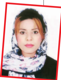
عهدیه صولت برد

غرق شعرت می‌کنم امروز هم با نوازش هایم از آن دورها این همه احساس باد ارزانیت ای فراتر از همه منشورها زندگی آیینه چشمان توست من در این آیینه دنیا دیده‌ام هر چه از خوبان عالم گفته‌اند در وجود دوست یکجا دیده‌ام