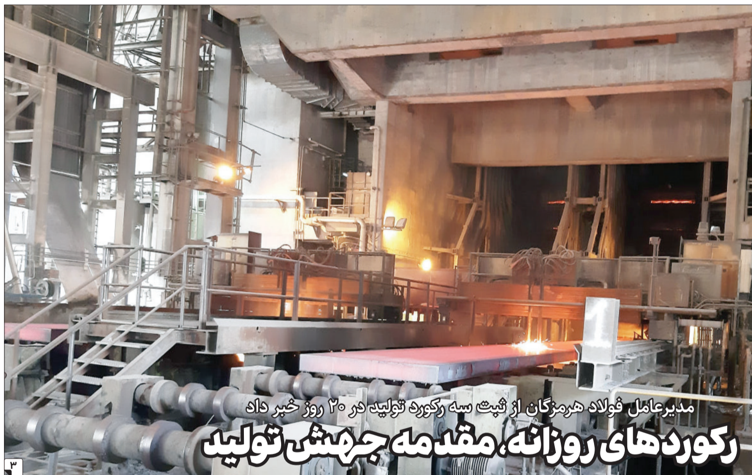
مدیرعامل فولاد هرمزگان از شپت سه رکورد تولید در ۳۰ روز خبر داد