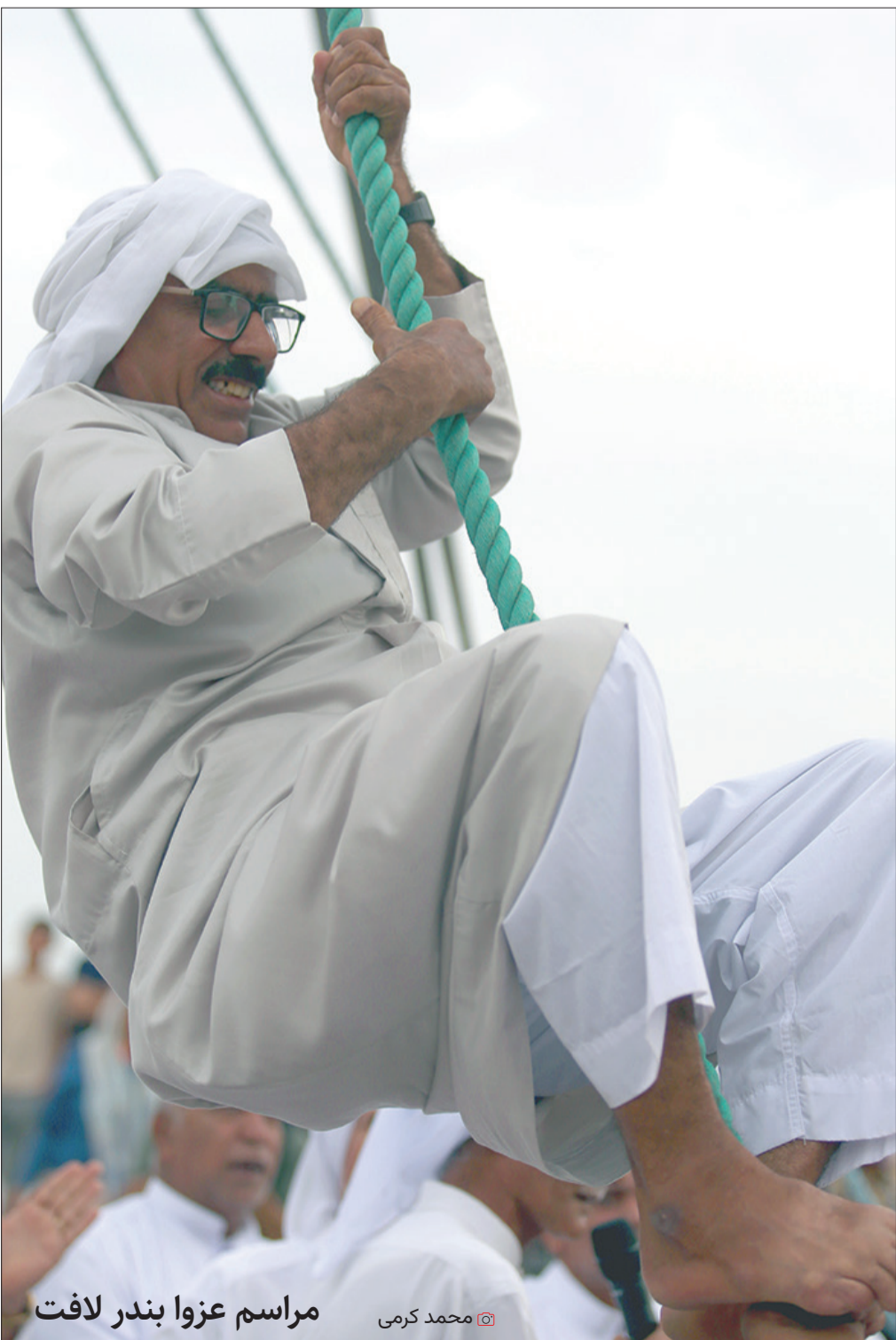
مراسم عزوا بندر لافت

به عنوان مثال، بر اساس توصیفی از نتیجه طراحی مورد نظر، چارچوبی را طراحی کند. همچنین می‌تواند به تشخیص مشکلات و یافتن علل ریشه‌ای آن‌ها و همچنین بهینه‌سازی استفاده از ابر شرکت برای کاهش هزینه یا بهبود عملکرد کمک کند. این قابلیت از طریق رابط چت در دسترس خواهد بود و مستقیماً در تعدادی از محصولات Google Cloud تعبیه شده است.