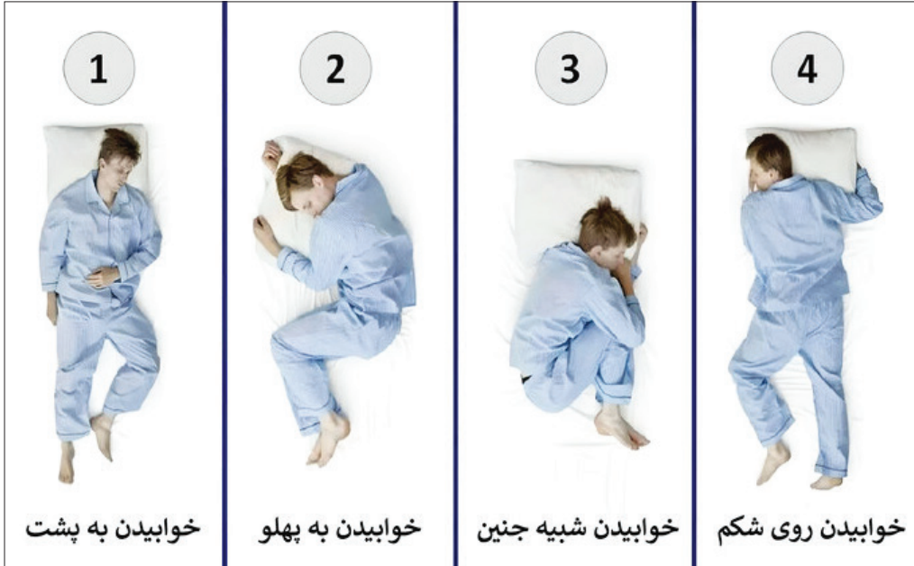
خوابیدن به پشت

شکل رهایی برای مردان: مردانی که اینگونه می‌خوابند، اشتیاق پنهانی برای فرار و انجام کارهای خود دارند. بسیاری از آنها اغلب این کار را انجام می‌دهند - در سراسر جهان بادبانی می‌کنند، از قله اورست صعود می‌کنند یا کانال مانس را شنا می‌کنند. مردانی که به این شکل می‌خوابند، دوستان فوق‌العاده‌ای پیدا می‌کنند و به دوستی خود بسیار پایبندند.