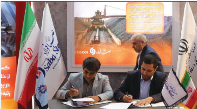
در ششمین نمایشگاه توانمندی‌های صادراتی ایران (ایران اکسپو) بازدید کردند.

شرکت صبا فولاد خلیج فارس در راستای توسعه ارتباط صنعت با دانشگاه، قرارداد اجرای پروژه های تحقیقاتی و پژوهشی با دانشگاه علم و صنعت منعقد نمود. به گزارش صبح ساحل، این قرارداد در غرفه شرکت صبا فولاد خلیج فارس در ششمین نمایشگاه توانمندی های صادراتی جمهوری اسلامی ایران (ایران اکسپو) به امضا رسید. بر اساس این قرارداد طرح‌ها و پروژه‌های تحقیقاتی و پژوهشی با موضوعات مورد نیاز شرکت صبا فولاد خلیج فارس توسط دانشگاه علم و صنعت انجام می‌شود. شایان ذکر است؛