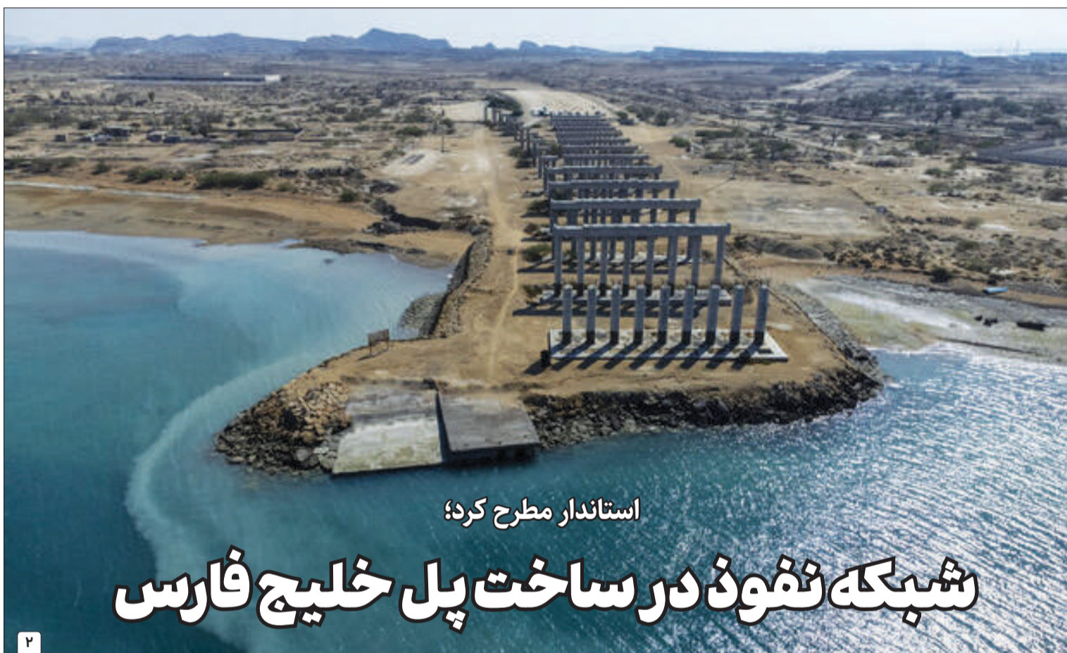
استاندار مطرح کرد؛