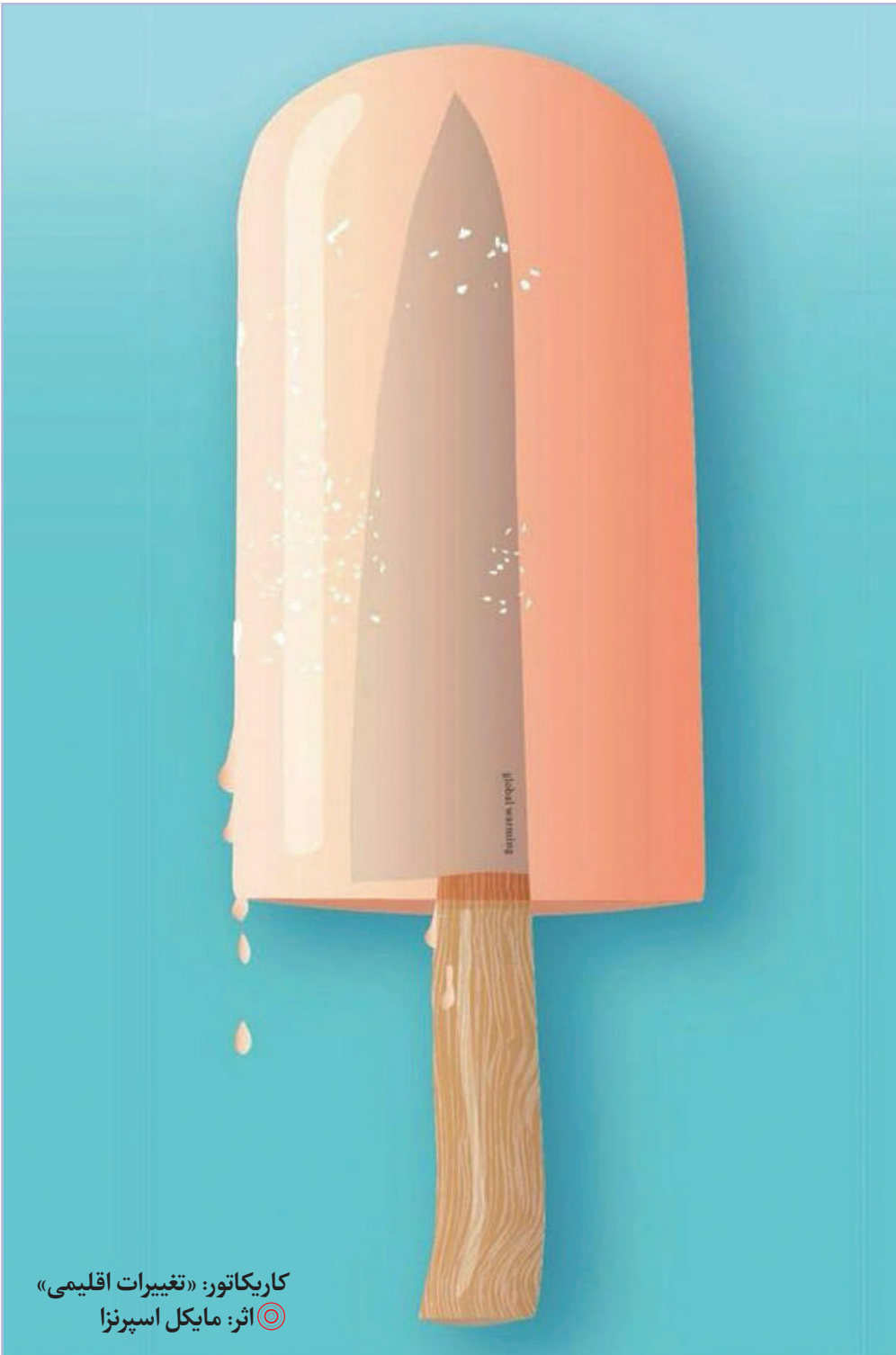
کاریکاتور: «تغییرات اقلیمی» آثر: مایکل اسپرنزا