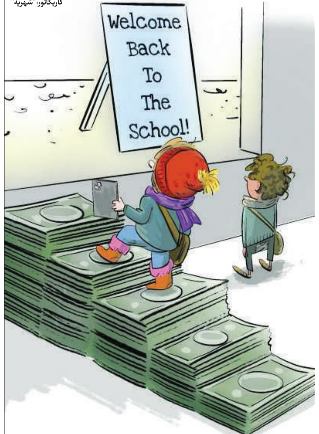
اثر: رامسس مورالس ایزکوئیرودو